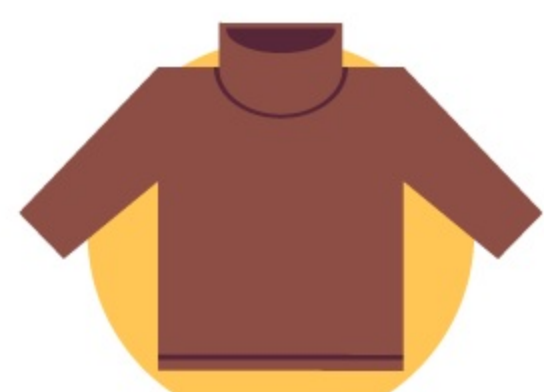
пару водолазок и свитеров для холодного времени года