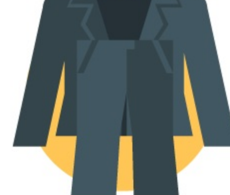
брючный костюм на осеннее-зимний период