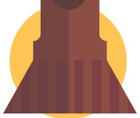
сарафан или платье