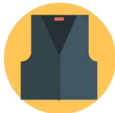
жилет классический или трикотажный